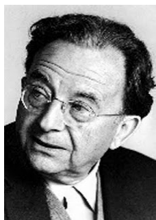
Nace: 23 de marzo de 1900 Lugar: Frankfurt, Alemania Muere: 18 de marzo de 1980 Lugar: Suiza

http://www.psicologia-online.com/ebooks/personalidad/fromm.htm