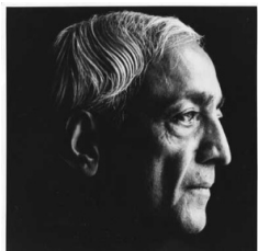
Nace en Madrás 1895 Muere en EEUU 1986 http://www.jiddu-krishnamurti.net

Si está preso, poco importa describirle lo que es la libertad. Mi verdadero propósito es mostrarle qué ha creado esta prisión y que usted lo destruya, si es que le interesa y si no le interesa entonces ya es asunto suyo. K, 1933