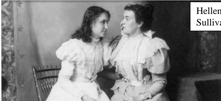
Hellen Keller con su profesora Anne Sullivan