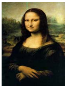
Leonardo Da Vinci La Gioconda (óleo, 1503-1506)

Este mes te proponemos un juego para ampliar la mirada. ¿Te atreves? Si tu respuesta es un sí te invitamos a que tomes una noticia cualquiera y la exprimas, la mires del derecho y del revés, de arriba hacia abajo y de abajo hacia arriba. Cuando le hayas dado mil vueltas, párate a reflexionar e intenta relacionarla con los conceptos de ecología emocional que han ido apareciendo en este boletín en sus cinco meses de vida. Si tienes otros, perfecto, puedes añadirlos. ¿Qué opinas?